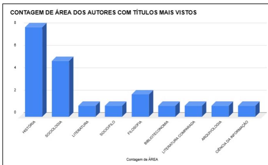
Gráfico 2 – Contagem dos autores por área do conhecimento

cujas abordagens ampliam o escopo conceitual da memória, introduzindo aspectos como o esquecimento, a subjetividade e a experiência temporal. O gráfico 2 abaixo inclusive dividido por área do conhecimento nos permite visualizar melhor esta observação.